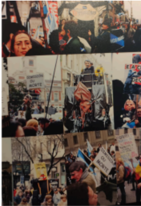
Figura 1. Collage con fotografías en Nunca Más. A voz da cidadanía. Tomo 1. , publicado por la editorial Difusora Editora (2003)